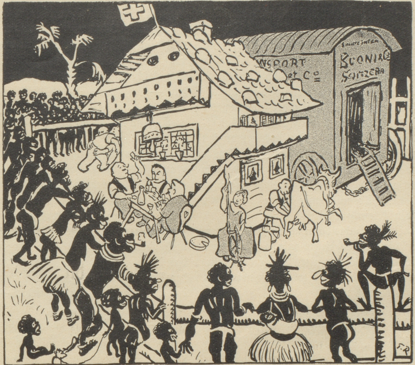
In Zürich veranstaltete die Tiergartengesellschaft eine Menschenschau (Indier). Wie wäre es, wenn die Neger zu irgendwelchem wohlthätigen Zweck eine Europäische Schau (z. B. Schweizerschau) veranstaltet hätten?

Begrüßen Sie mich also in die Ferien bis dahin Ihr ergebener Hgum.