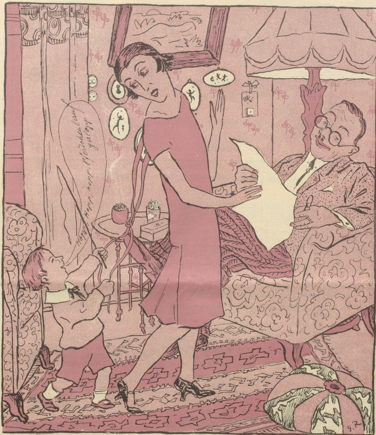
„Das ist lieb von Dir, Mamachen, daß Du an mich gedenkt hast: jetzt kannst Du endlich mit mir spielen.“

pfe ging jedoch verhältnismäßig schnell. Die gewandte Verkäuferin breitete flink ein Paar nach dem andern aus, die Hand hineinschiebend, daß Gewebe, Farbe und sonstigen Eigenschaften schnell geprüft werden konnten. So war denn auch schon bei der etwa 120. Vorführung der Richtige gefunden. „Ich möchte einen Kaffee!“ lechzte ich; wir nahmen ihn, aber in höchster Eile, denn sie brauchte zum neuen Kleid noch einen passenden Hut. Im Hutladen gelang es mir, einen freien Stuhl zu bekommen, auf dem ich sogleich in tiefen Schlummer sank. Leider ward ich daraus nur zu bald durch die Aufforderung erweckt, mein Urteil über die