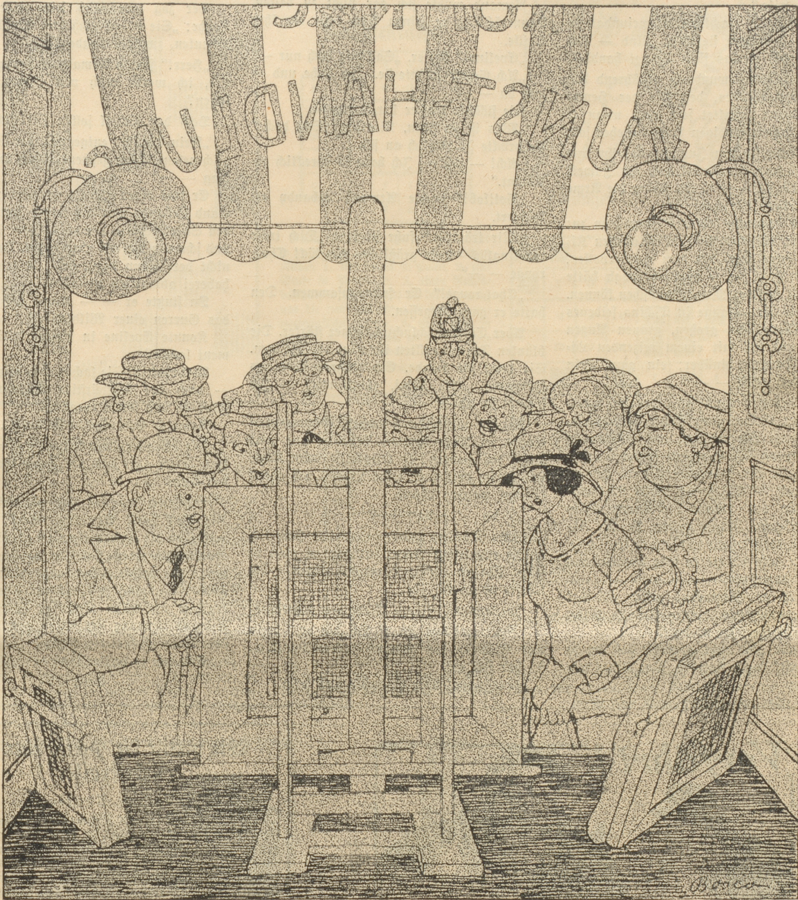
„Leda mit dem Schwan“