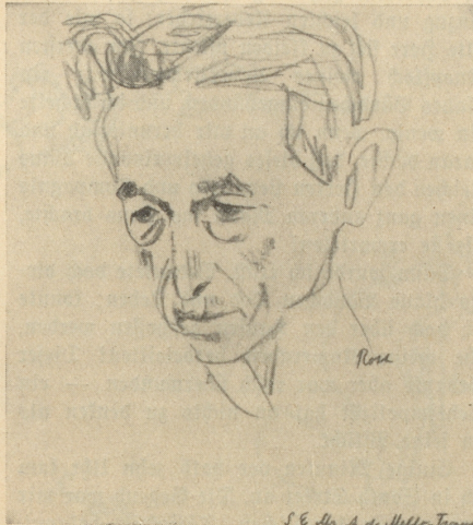
A. DE MELLO-FRANCO Brasilianischer Staatsmann

heimlichen Affäre zu spielen und den Wucherer morgen früh im Central-Park zu treffen . . .