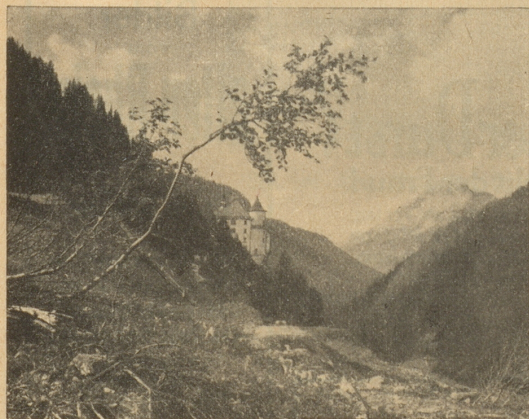
Kurhaus Val Sinestra

Unter dem Titel „Telephon und Radio im Eisenbahnwagen“ las man in einem Schweizerblatt: „Das angewandte System ist ziemlich einfach, indem die Vibration des Sendeapparates durch Infektion auf die längs der Bahnlinie laufenden Telephondrähte übertragen werden.“ Hoffentlich werden durch diese Infektion nicht auch die Angestellten oder gar die Reisenden gefährdet. Sonst bleibt dann aller-