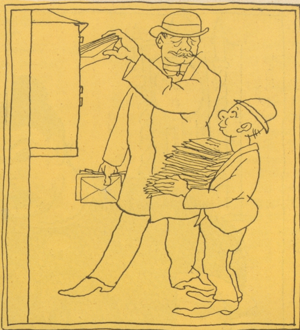
„Der Herr Prokurist schickt mich. Der Herr Nationalrat möchte so gut sein und die heutige Post im Bundeshaus einwerfen.“