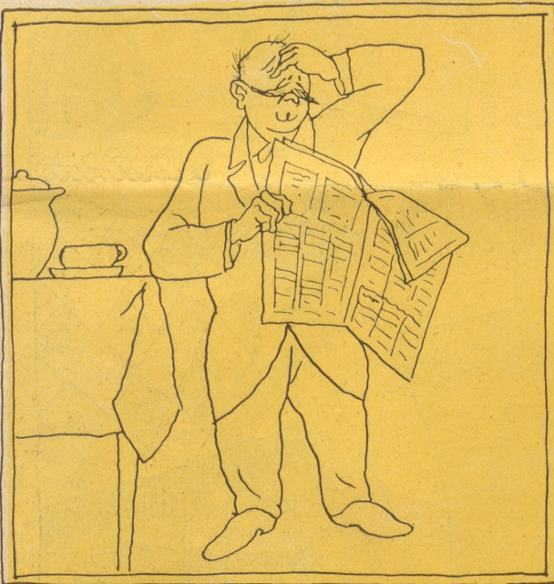
„Oh! Ich bin ruiniert! Nicht mehr gewählt! Wo treib ich das viele Geld für das Geschäftsporto auf!“