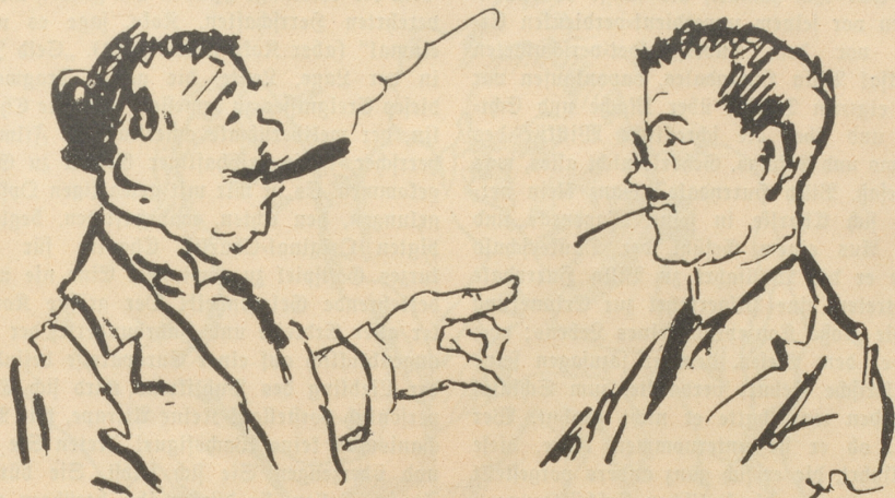
Herr Kollega, Sie sind ein Unicum, Sie haben sich noch nicht in der Presse über die Scala-Orchester-Angelegenheit geäußert.

nenlicht und fühlte sich im Straßenstaub sehr wohl. Ein etwa zweijähriges Kind war aus seinem Körbchen gerollt, hatte aber keinen Schaden genommen, da es in ein dickes rotes Steckbett gewickelt war; eine weiße Fox-terrier-Hündin mit drei Kleinen ließ sich durch den Zwischenfall in ihrem Stillgeschäft nicht im geringsten stören und aufgeregt war nur ein grünroter Papagei, der sich an einer am Ständer befestigten Kette verwickelt hatte und aus Leibeskräften kreischte: „Hier ist zu sehen der echte Charlie Chaplin, eintrrrreten Herrschaften, eintrrrreten!“ Seelenruhig und mit großem Appetit vertiefte sich der Esel in das zum Trocknen ausgebreitete Wiesenhheu, ohne sich im mindesten um die Beschöerung, die er angerichtet, zu kümmern. Der unglückselige Wagenlenker, nachdem er sein in den Nacken gerutschtes Hütlchen korrekt an seinen Platz gebracht hatte, machte sich daran, Ordnung in das Chaos zu bringen, das inmitten der weiten Seideinsamkeit wirt auf der Landstraße lag, von Lärchen hoch oben übertrillert, die von dem Malheur nichts wußten. Ganz ferne in der flimmernden Bläue stand ein Kirchtürmchen spitz in die Luft. Eine Windmühle tat, als ob sie sich Kühlung zusähele, die Grillen zirpten wie vorher, nichts auf der Welt nahm Anteil, und das ganze Unglück lastete allein auf diesen knabenhaft schmalen Schultern, die hilflos halb, halb entschuldigend zuckten, als wollten sie sagen: was kann man da machen — es ist ein Fatum.