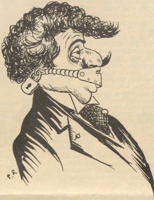
Der italienische Tenor während seiner Schweizer-Tournee mit einer speziellen Vorrichtung gegen die Beschlagnahme seiner Stimme durch die Zürcher Behörde.

(In der leidlich peinlichen Affäre Stamm-Toscanini [Scala-Orchester] wurden den italienischen Musikern, die durch die Nachenschaften Stamms schon genügend geschädigt waren, von Zürcher Behörden auch noch die Instrumente mit Beschlag belegt.) Rabinovitch