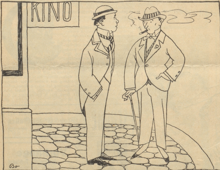
„Schminkt mit in Kino?“ — „Gehst nüd, daß ich rauche?“ — „So ghei de Stumpen-erwäg!“ — „Ja chascht dänke, wägem Kino en „Weber's Habanero-Stumpe“ erwäg gheie!“

Durch einen Wink rief er den zweiten Di-