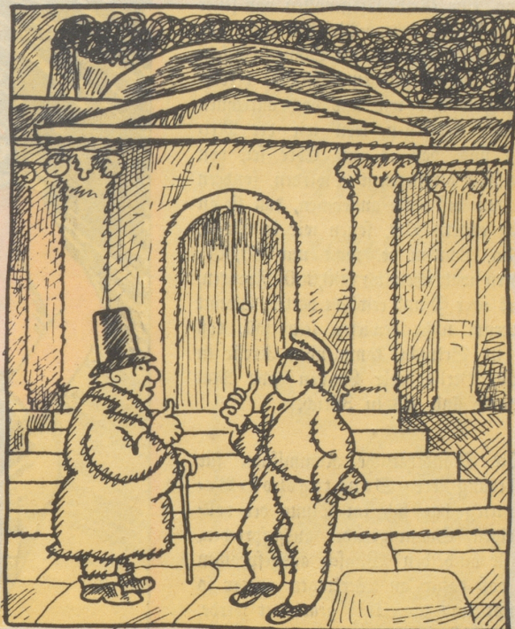
„Mit dere Kremation isch hüt nüt, de Ma isch nu schitob gfi.“ „Das isch jekt z'pot, es isch scho gheizt.“