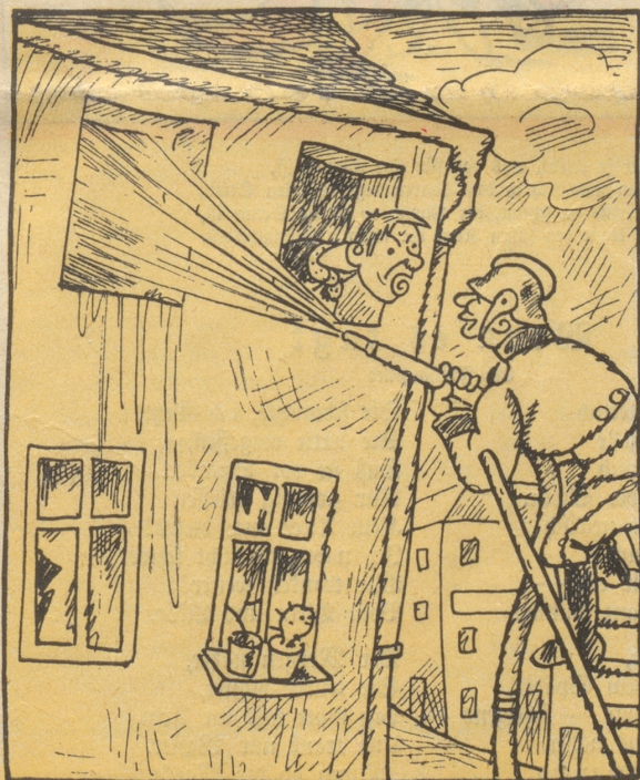
„Heda! es isch ja scho lang glöschet gfi, bis Ihr cho sind!“ „We häd eus grüest und jekt wird gschprüzt!“