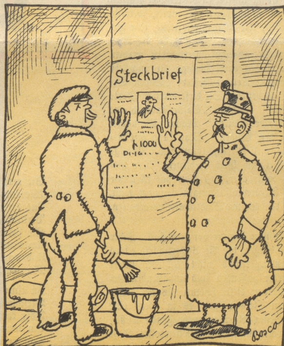
„Nüme nötig, mer hände!“ „Die werdet jekt no aklaubt!“