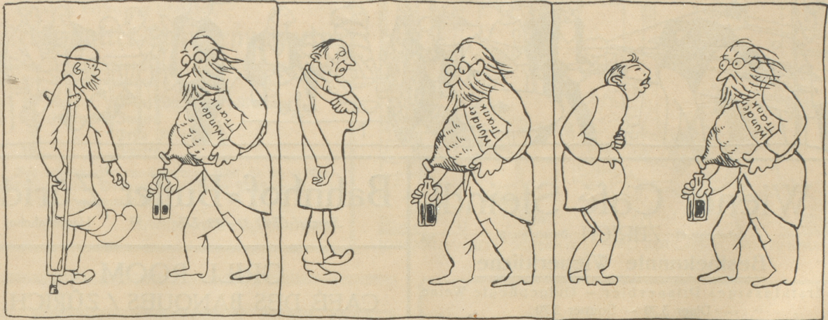
Das Beste für ein krankes Bein