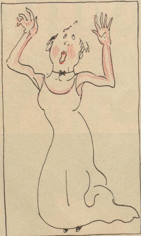
Fräulein Bethli Zowäger