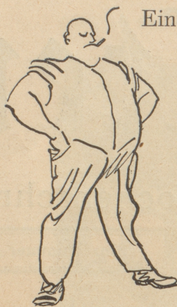
Seine Majestät der Produzent (wie er sich im Kriege ausgebildet hat)