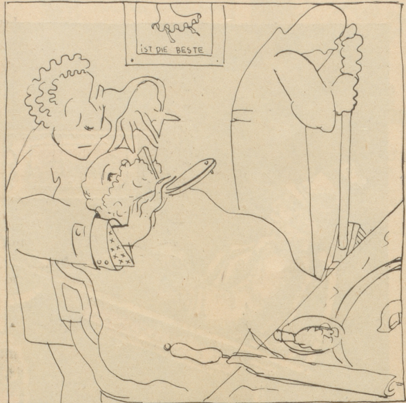
— Im Djent, nda soll widä was los sein, haben Sie eine Ahnung, was? „m — m“