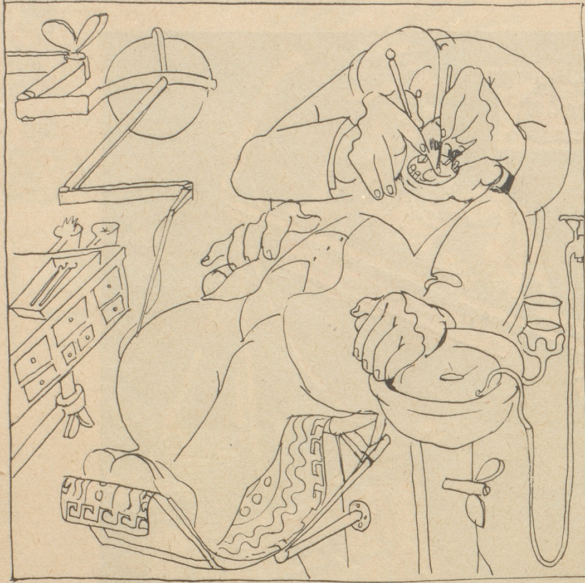
— Der Mund offe loh, wenn i bitte darf — apropos — händ Sie en Ahnig was im Orient los isch? „ä — ä“