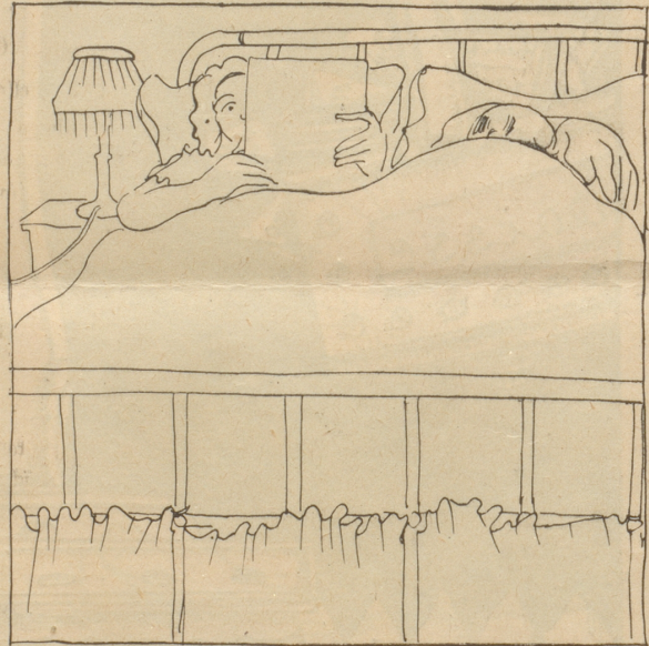
— Du, im färne Dschte chum i nit ganz druus, do wägem Sulttan die Gschicht „mh — ptüh“