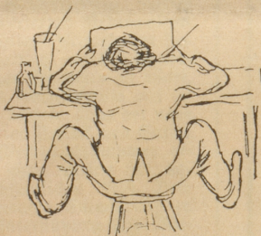
Man geht an die Arbeit