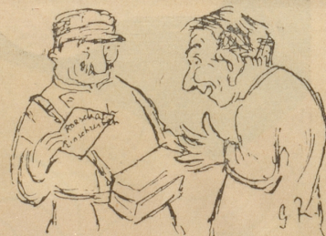
Und am ersten des Monats hat man dafür die ehrlich verdiente Belohnung