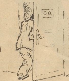
Man sucht die Einsamkeit