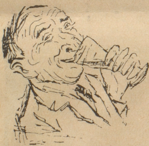
Man kräftigt sich