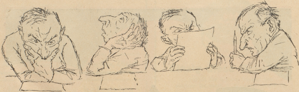
Man vertieft sich in die Gedanken