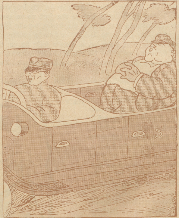
Herr Späckli hulbigt darauf dem Autosport