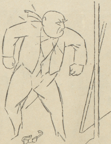
Das verdamnte Kragenknöpfli