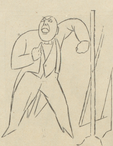
Natürlich die Kravatte