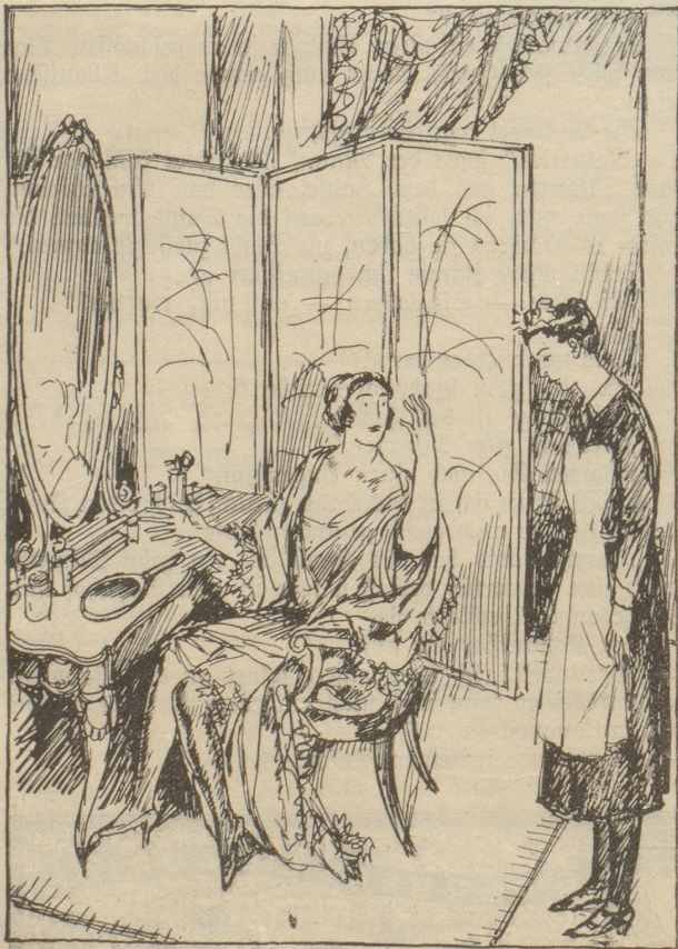
Wie stellen Sie sich das eigentlich vor? Jetzt haben Sie wieder vergessen mir die Melorita-Deesse No. 210, die Crème Mara und das Eau de Cologne No. 234 von Klement & Spaeth zu besorgen. Diese drei Edelprodukte sind einfach für eine wirkliche, gesunde Hautpflege unentbehrlich.

Und in diesem Augenblick wurde Frau Ilsen ernstlich beunruhigt, denn ihrem Sebastian hatte sie in den