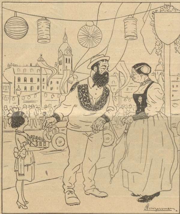
Länder Kaveri: „Was, es Schwyzer Chrütz mues i no alege — das me au weiß, das ig ä Schwyzer sig! — Kathri! — z'leid spile mer hüt Us-Länder!“