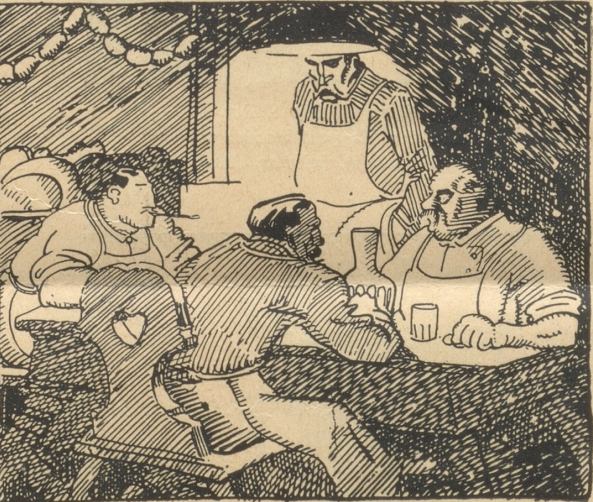
Die Metzger: „Diese verfluchten Bauern mit ihrem Laur, und ihre Milch und ihr teures Vieh sind an allem Schuld.“