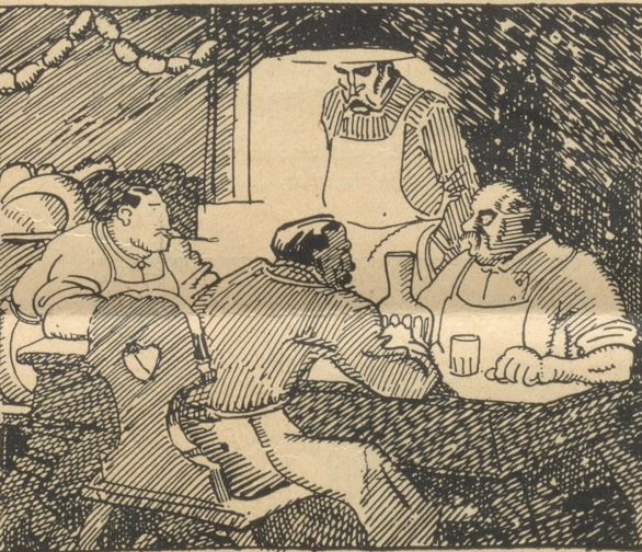
Die Metzger: „Diese verfluchten Bauern mit ihrem Lur, und ihre Milch und ihr teures Vieh sind an allem Schuld.“