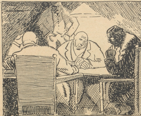
Die Industriellen: „Die Einfuhrverbote, die erhöhten Zölle, das sind die Schädlinge mit dem 8-Stundentag.“