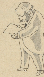
durch Memoranden und Ultimaten nicht gelungen ist