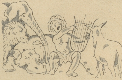
— wäre ihm durch Orpheus Kunst.