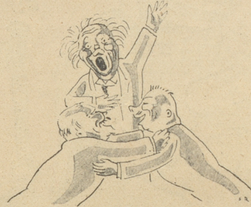
— geglückt. —