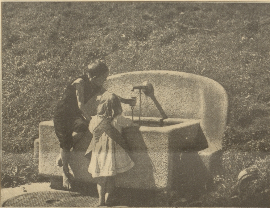
Architekt: Pflughard & Haefeli St. Gallen-Zürich