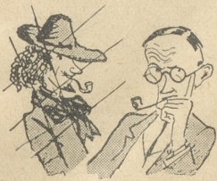
Will man ein bekannter Maler werden, so breche man mit der Vergangenheit.