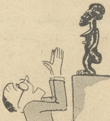
Man schwärme für die Negerkunst.