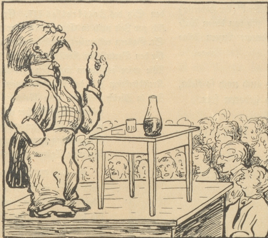
1. Bei einer politischen Wahlrede