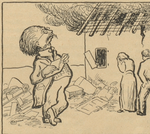
3. Als Versicherungsbeamter