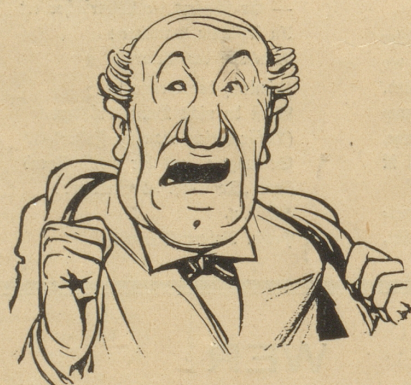
Jedefalls wieder amene Grosfrot, wo z'breitspurig zum Fenster use g'redt het“. R. G.