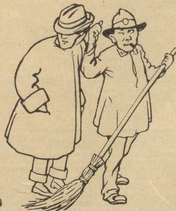
Zeichnung von Carl Gierpien

Ich schlenderte planlos durch die Straßen der Stadt St. Gallen, gelangte so vor das Kloster und sah dann das Regierungsgebäude, in welchem sich scheinbar der Große Rat wieder zu einer Session zusammengefunden hatte. Während ich gehobenen Hauptes die Front des Amtsgebäudes abließ, stieß ich auf der Höhe des Großratsitzungsaaes auf etwas Hartes und beim Nähergehen gewahrte ich ein kostbares künstliches Gebiß. Einen gerade in der Nähe seines Amtes waltenden Straßenkehrer fragte ich ganz unbefangen, wem wohl dies herrenlose Gebiß gehören möchte, worauf er mir ins Ohr flüsterte: „Das g'hört