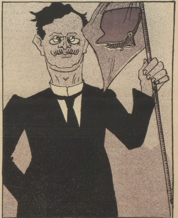
Um Herrn Ebert und dessen neu eingeführter Reichspräsidenten-Standarte nichts nachgeben zu müssen, wird Herr Reichskanzler Dr. Wirth ein leeres Portemonnaie, Sinnbild der deutschen Finanzlage nach Annahme des Ultimatums, als Insignium führen.