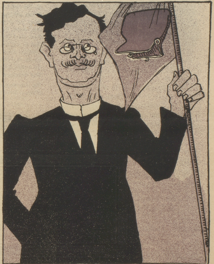
Um Herrn Ebert und dessen neu eingeführter Reichspräsidenten-Standarte nichts nachgeben zu müssen, wird Herr Reichskanzler Dr. Wirth ein leeres Portemonnaie, Sinnbild der deutschen Finanzlage nach Annahme des Ultimatums, als Insignium führen.