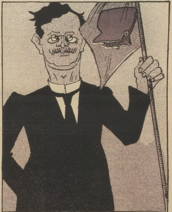
Um Herrn Ebert und dessen neu eingeführter Reichspräsidenten-Standarte nichts nachgeben zu müssen, wird Herr Reichskanzler Dr. Wirth ein leeres Portemonnaie, Sinnbild der deutschen Finanzlage nach Annahme des Ultimatums, als Insignium führen.