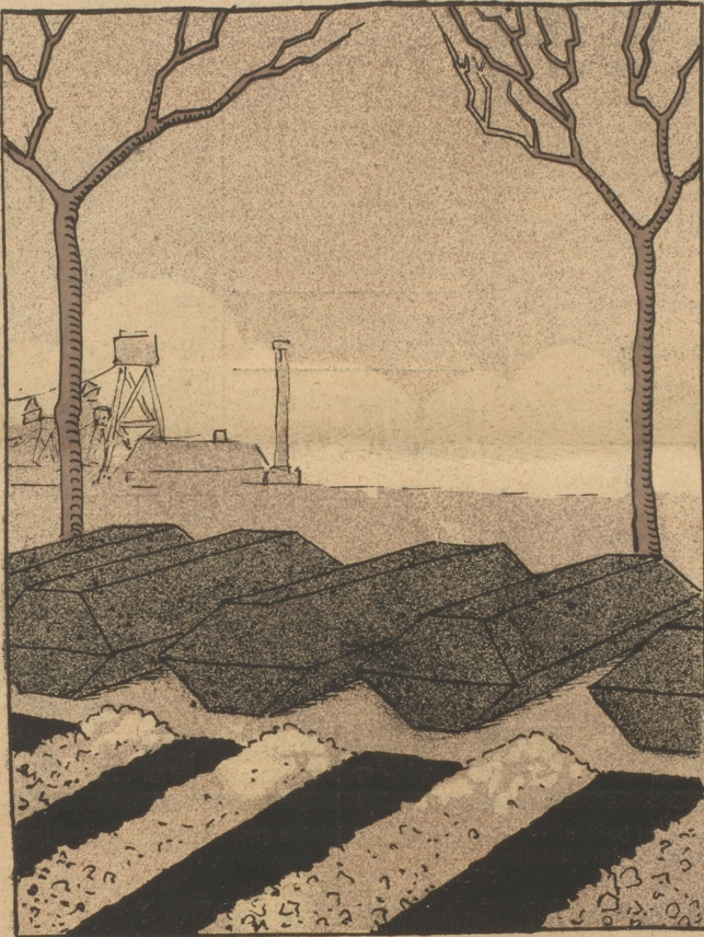
Wegen böswilligen Nichterfüllens des Kohlenabkommens, da die Produktion der Grube Wendel bei Sorbach eingestellt ist, infolge einer Explosion, wobei 11 Bergleute tot und 150 verschüttet wurden.

(Wie wir aus zuverlässiger Quelle vernahmen, soll die Entente eine neue Note mit der Androhung der Besetzung weiteren deutschen Gebietes und anderer Zwangsmaßnahmen an Deutschland gerichtet haben, wegen erneuter Verletzungen des Versailler Vertrages.)