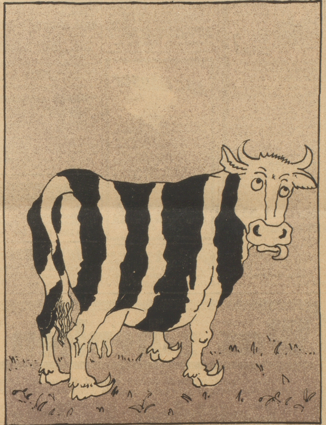
Wegen passiven Widerstandes und böswilliger Herausforderung durch Lieferung einer Kuh an die Wiedergutmachungsbehörde, welche nicht das garantierte Quantum Milch gibt und außerdem durch ihr schwarz-weißes Fell unangenehm auffällt; man vermutet, die Kuh sei „deutsch-national“ oder preußisch orientiert.