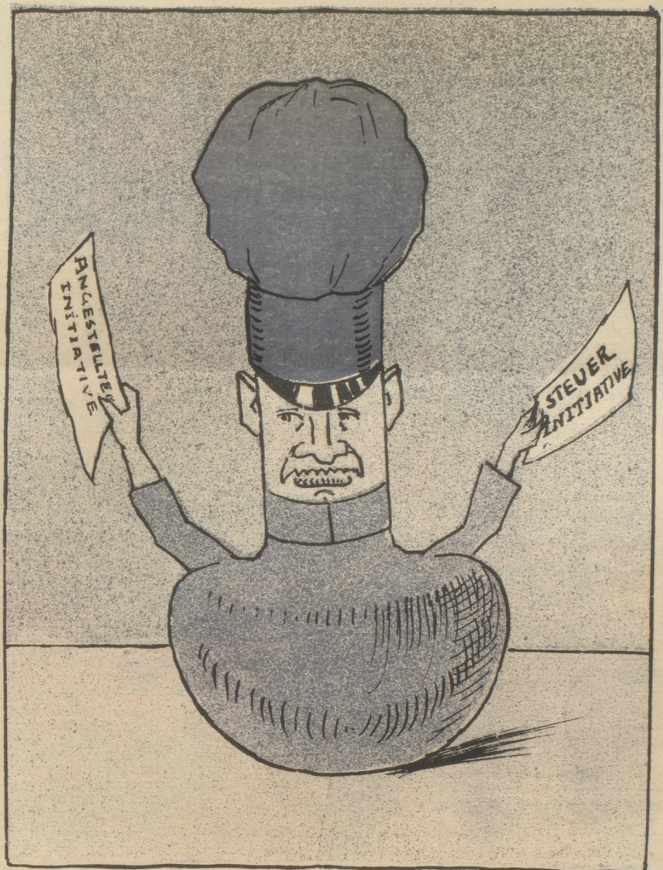
Sozi, das Schweizersehaufmännchen, kaum verschunden, kommt es schon wieder mit einer neuen Steuerinitiative zum Vorschein.