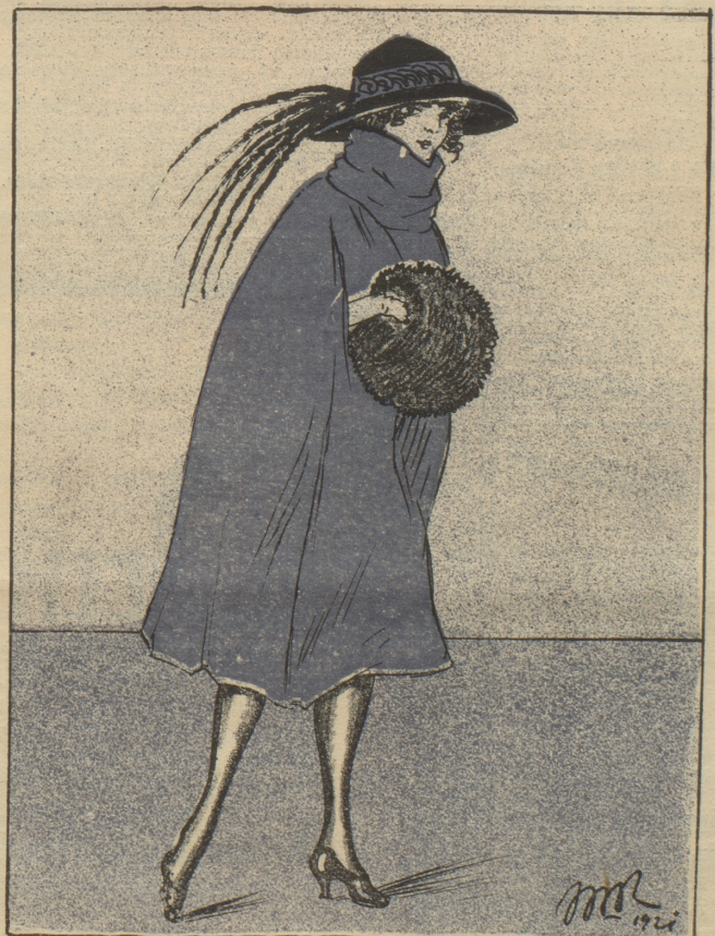
Ad oculus wird hier demonstriert, daß auch ein Schweizer Kind chtc sein kann, besonders, wenn es gerade von einer Valutareise zurückkommt.