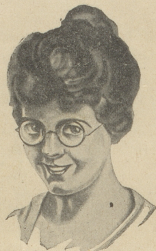
Die Brille dem Geschmack zur Wahl, Als Brillenglas nur Zeiss Punktal!

empfehlen Ihre nur la Weina Frau B. Frey , früher Büffet St. Margrethe n