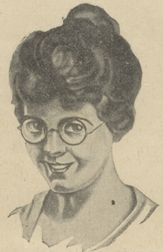
Die Brille dem Geschmack zur Wahl, Als Brillenglas nur Zeiss Punktal!