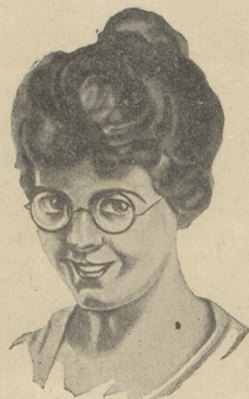
Die Brille dem Geschmack zur Wahl, Als Brillenglas nur Zeiss Punktall!