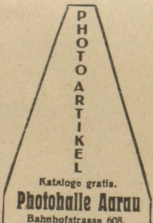
PHOTO ARTIKEL Kataloge gratis. Photohalle Aurau Bahnhofstrasse 608.

Ratschläge, diskret. Case Rhône 6303, Genf. 2282