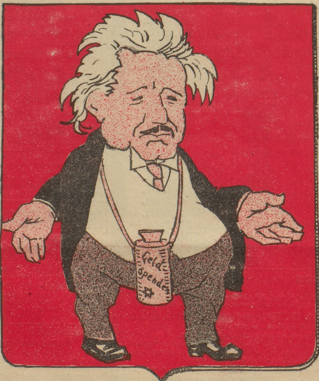
Das Wahrzeichen des jüdischen Staates in Palästina wird in würdiger Weise Professor Einstein mit der Sammelbüchse verwerten.