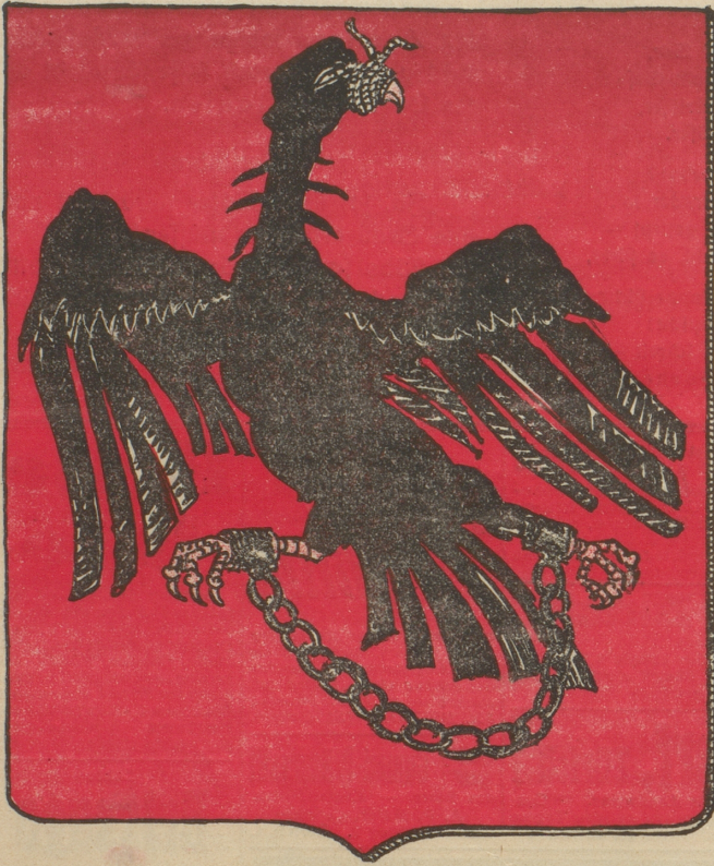
Der neue preußische Adler soll nunmehr noch treffender durch zugebundenem Schnabel und gefesselten Klauen charakterisiert werden.