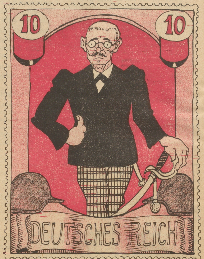
Herolisch immer in der Pose Ist Noske mit kariertem Hose.