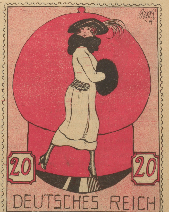
Anstatt der Größen Deutschlands, die recht problematisch, Wär' auch ein nettes „Schwobemeidle“ sehr sympathisch!