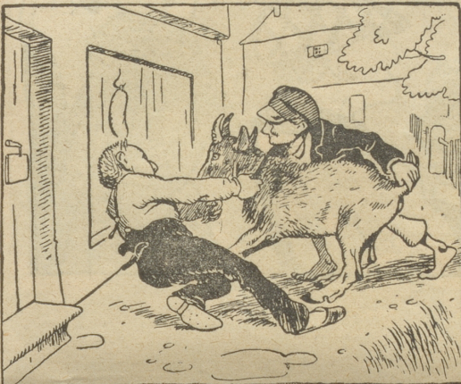
Da kommt ein Stiegenbock gesprungen; Ein Blitz durchzuckt das Hirn der Jungen!

Wenn die Frau die Wahl hat zwischen Männern, so liebt sie immer den, der weniger wert ist. Den besseren nimmt sie nur zum Freunde, zum Vater ihres Kindes macht sie den unauglicheren. Ihr Gefühl wählt falsch, weil es die Sinne befragt.