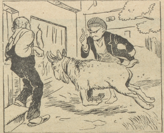
„Er attackiert sein Spiegelbild Und uns're Sehnsucht wird gestillt.“

Die größte Grausamkeit des Daseins ist, daß man über die Leistungsfähigkeit des Körpers hinaus weiterleben muß.