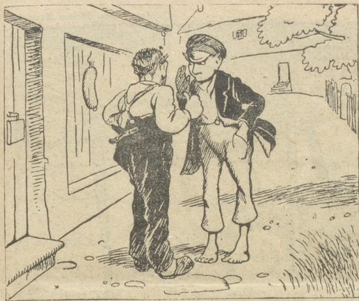
Schaut ihr die Blutmurst und die Knaben? Nun: diese möchten jene haben.