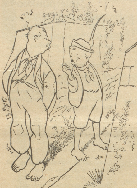
Wo ist der große Bruder?