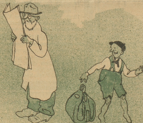
Brüh übt sich, wer ein Meister werden will.