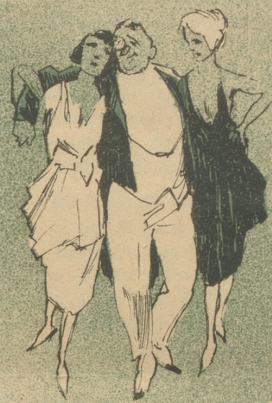
Das hat man im Alter in Sülle.