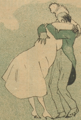
Sein oder nicht sein.