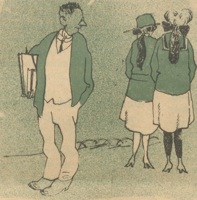
Was man in der Jugend sich wünscht,