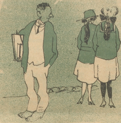
Was man in der Jugend sich wünscht,

(Zeichnungen von Hlfr. Birkhofer, Daboe)