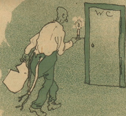
Ein guter Mensch in seinem dunkeln Drange Ist sich des rechten Weges wohl bewußt.