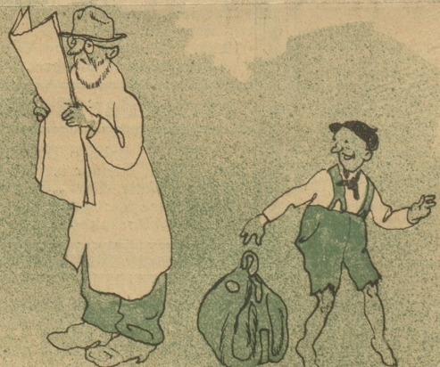
Brüh übt sich, wer ein Meister werden will.