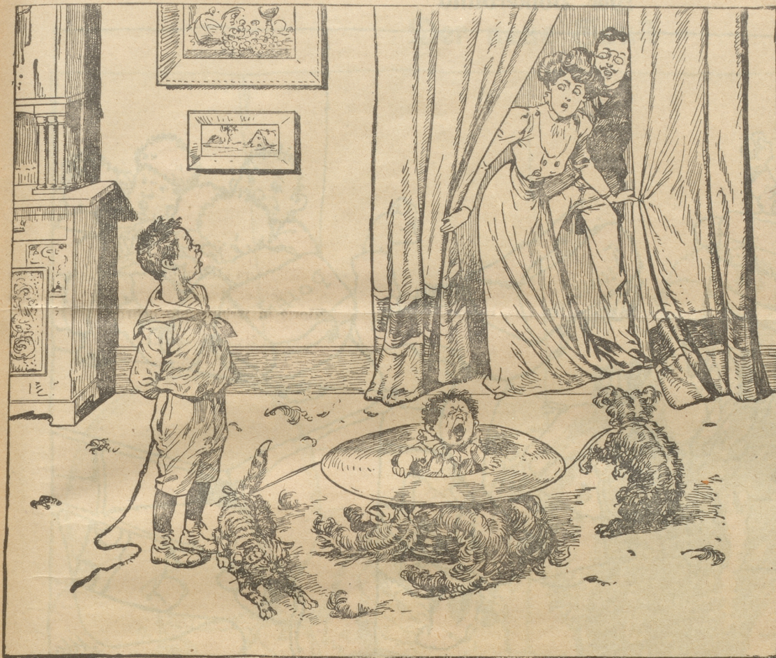
Kinderspiel. — Ein neues Karussell.