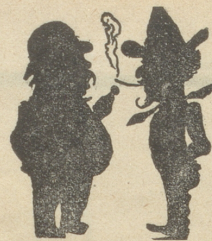
Dammhofer vom „Maginum“!

Direktor: Das verbitte ich mir! Sie haben nicht das Recht, meine persönliche Ansicht durch Teilung zu zerstückeln!