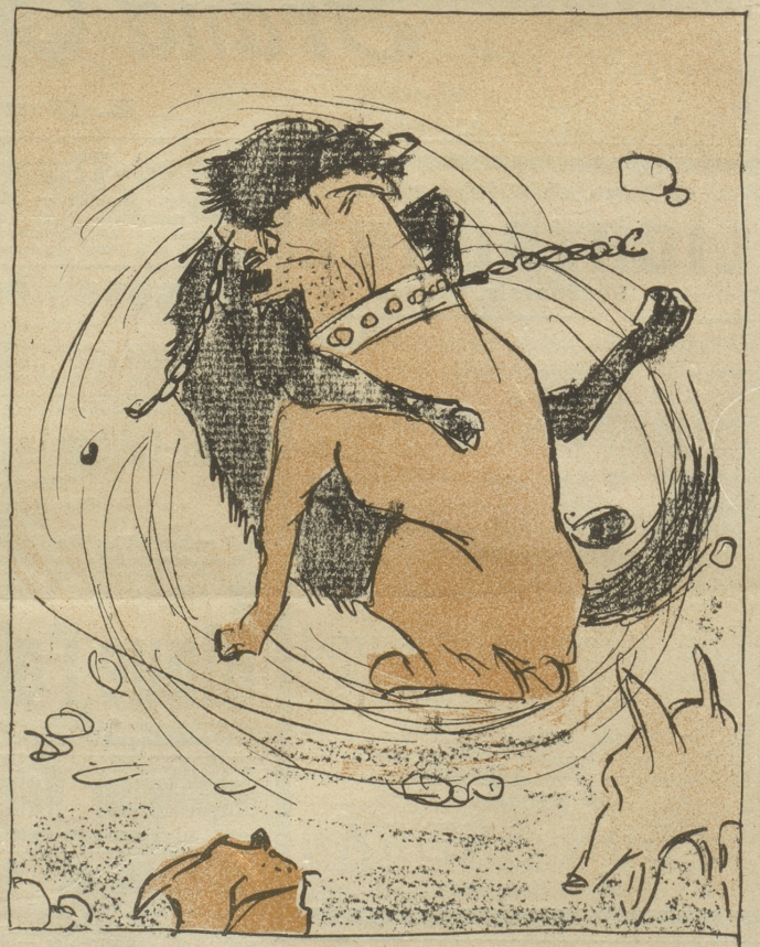
Drauf beide Köter sich zerbläuten, Woran sich dann die andern freuten!