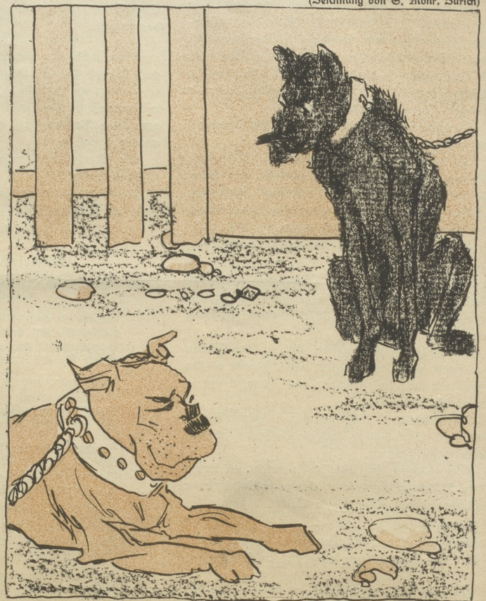
Das Volksrecht und die Tagwacht, Sie standen beide auf der Wacht.