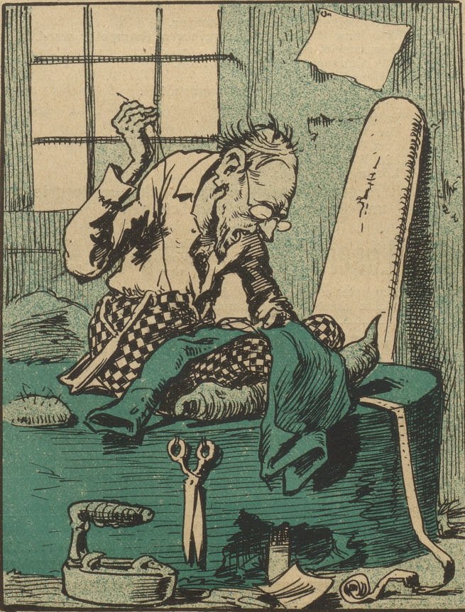
Der Vater war Schneider Schnitt Jacke und Hose.