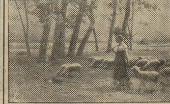
DANS LA CAMPAGNE, LEROLLE farbig, 17x28 cm . . . . . Fr. 2.75 auf Karton, 30x45 cm . . . . . Fr. 3.75

Im Hause Hotel MERKUR: La Küche u. Keller, moderne Zimmer, Gesellschafts-Lokale Billard — elektr. Licht — Zentralheizung — Telephon 43