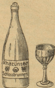
Goldene Medaille: Chur 1913

das wohlbekömmlichste Schweizer Tafelwasser für jedermann, sprudelt warm (20°C) aus der Erde, aus dem alkal.-salin. Sauerbrunnen Rhazüns, Graubünden, hervor!