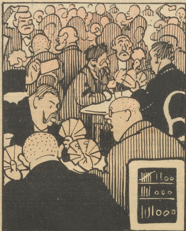
Zusgedehnte Kartoffelplantagen zieren die geweihten Stätten des Gambrinus.