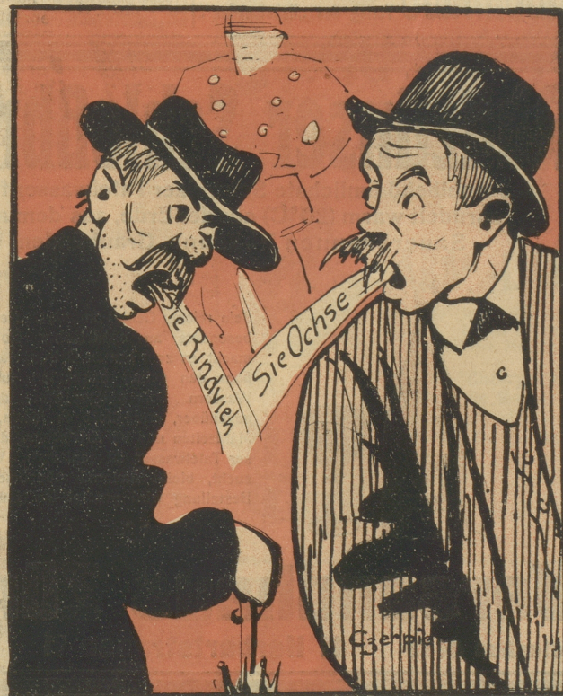
Um die Fleischversorgung zu sichern, werden Schimpf-namen, wie Ochse, Kalb, Schwein, Rindvieh etc. als gültig erklärt.