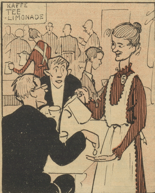
Der Zürcher Frauenverein hebt das Trinkgeldverbot in den alkoholfreien Restaurants auf, um das mangelnde Zuckerquantum durch das süße Minenspiel der Saalböcher zu ersetzen.