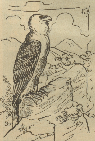
Wo ist die Beute des Geiers?