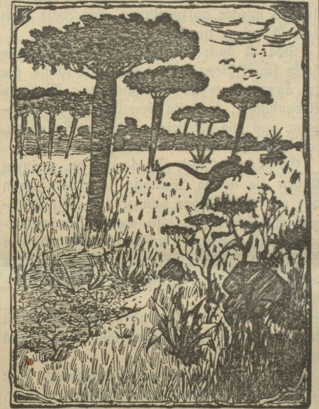
Wo ist der Australier?

Seder Abonnent dieses Blattes, der den Australier auf obigem Bild entdeckt und nachzeichnet, dann diese Lösung an uns einsendet, erhält das prächtige Vierfarbendruckbild