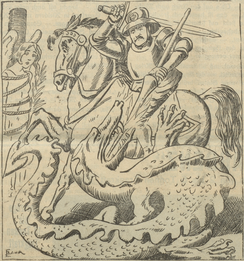
Ob's ihm gelingt, den Frieden zu erlösen Vom Drachentier des Krieges, von dem bösen?

Sind Sie auf Reisen? Wollen Sie duschen? — Abhilfe schafft: