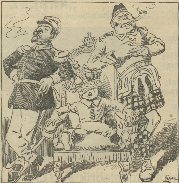
Die Stützen eines Thrones.

Visittarten liefert prompt und billig die Buchdruckerei Jean Frey in Zürich.