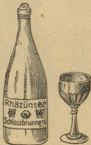
Goldene Medaille: Char 1913

das wohlbekömmlichste Schweizer Tafelwasser für jedermann, sprudelt warm (20°C) aus der Erde, aus dem alkal.-salin. Sauerbrunnen Rhazüns, Graubünden, hervor!